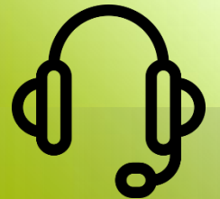
MESA DE AYUDA