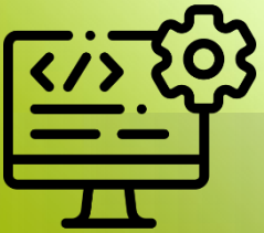
FÁBRICA DE SOFTWARE

Hemos estructurado nuestra empresa para atender integralmente las necesidades de TI de las empresas de hoy; 5 unidades especializadas de negocio nos permiten ofrecer soluciones completas a nuestros clientes